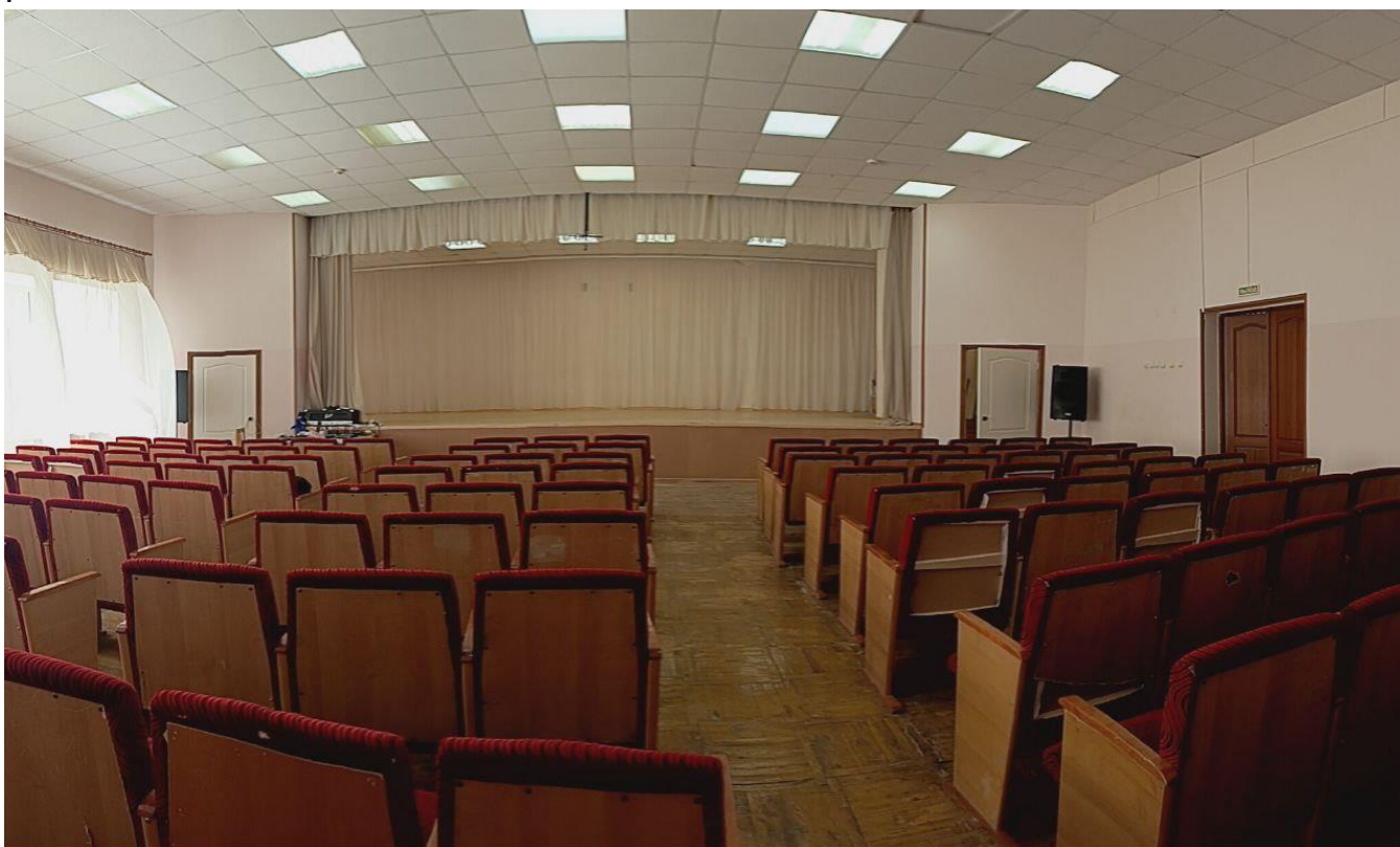
ФОТО АКТОВОГО ЗАЛА ПОСЛЕ