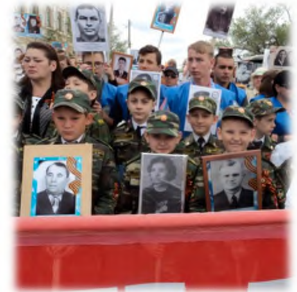
Акция «Бессмертный полк»