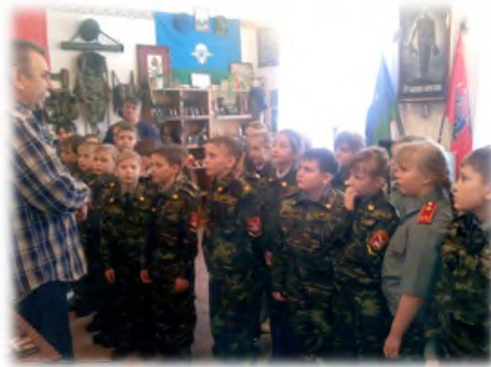
Экскурсия в музей «Боевое братство»