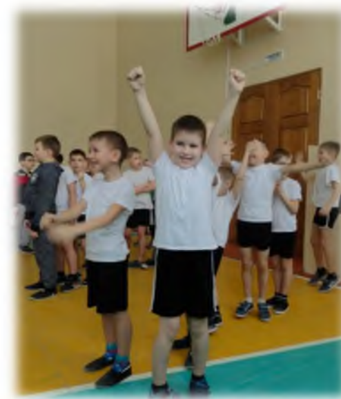
Состязания «А ну – ка, мальчики!»