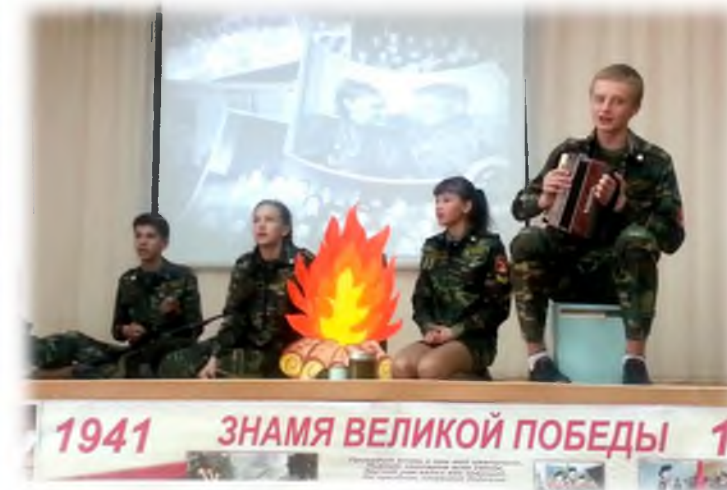
Фестиваль «Весна Победы»