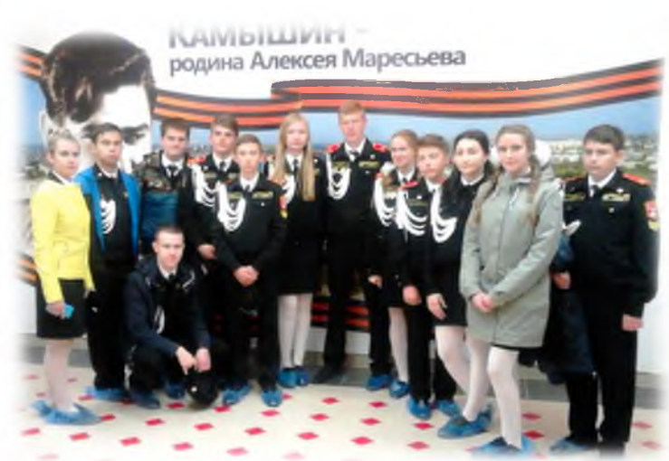
У памятника Герою России А.М. Колгатина