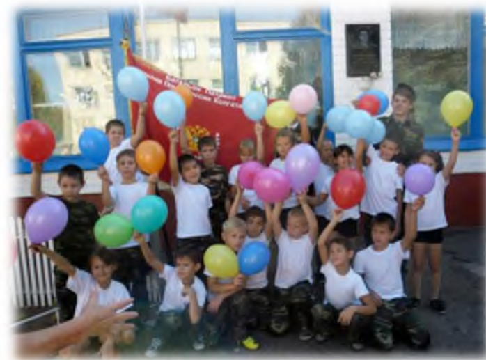
Участники игры «Зарница»