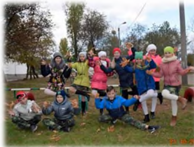
Фотокросс «Счастье просто жить»