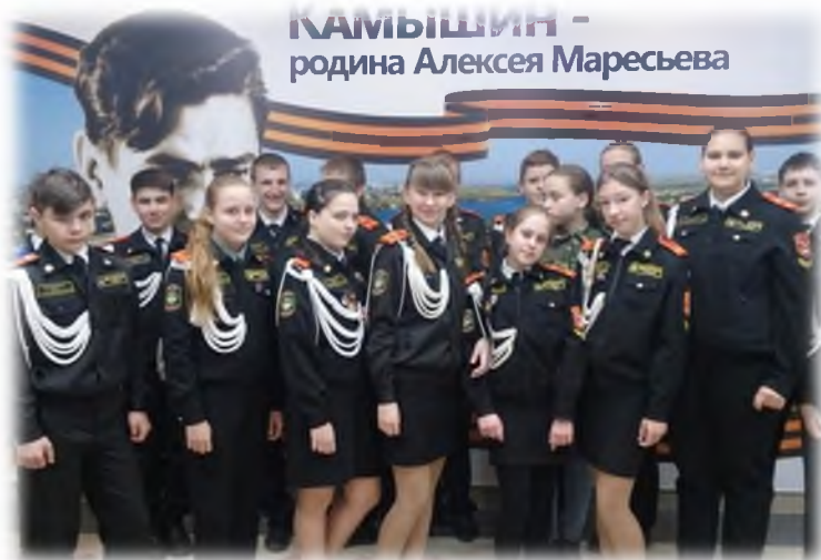
Экскурсия в музей А.П. Маресьева