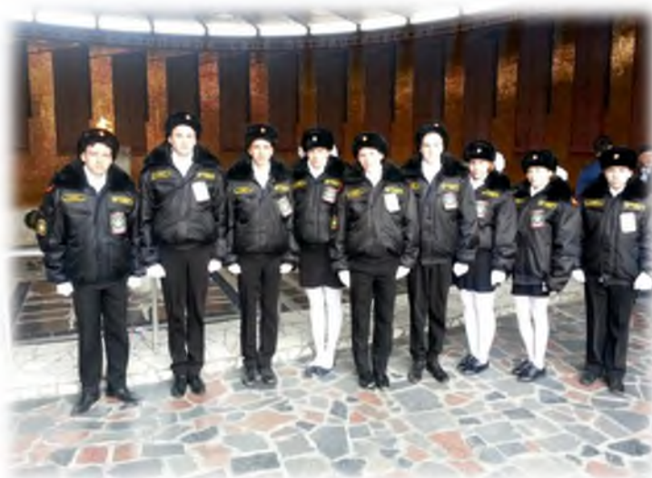
На Мамаевом Кургане