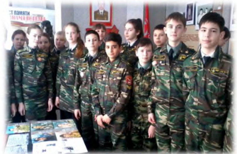
Экскурсия в музей им. Героя России А.М. Колгатина