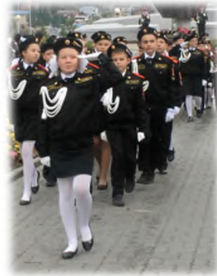
Торжественная церемония «Посвящение в кадеты»