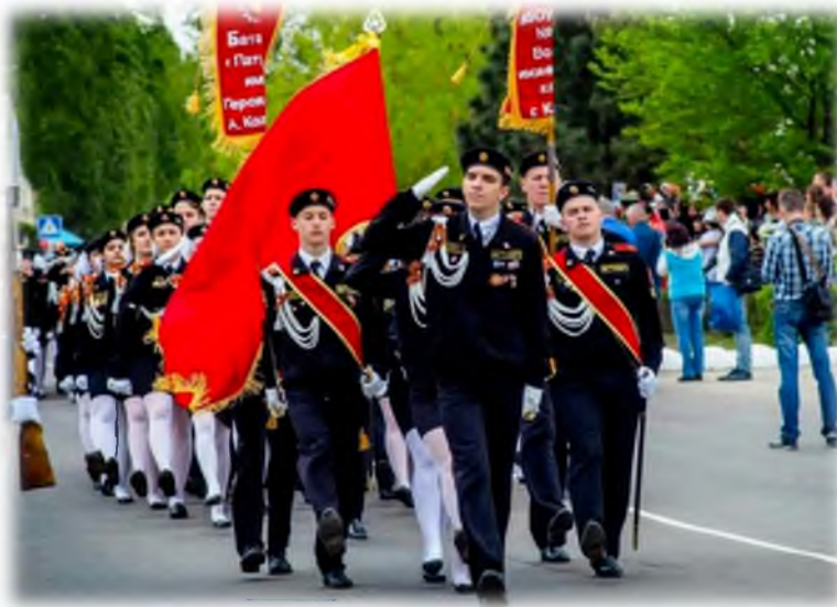
Участники торжественного парада