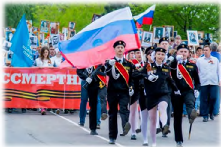
Участники Парада и акции «Бессмертный полк»