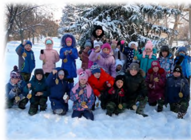
Акция «Зимующие птицы»