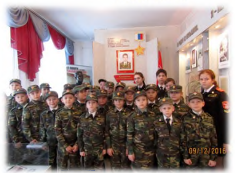
Экскурсия в музей А. Колгатина