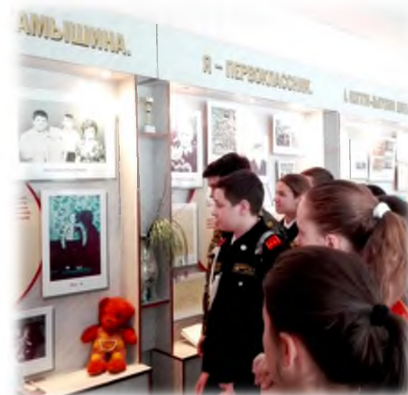
Экскурсия в музей им. Героя России А.М. Колгатина