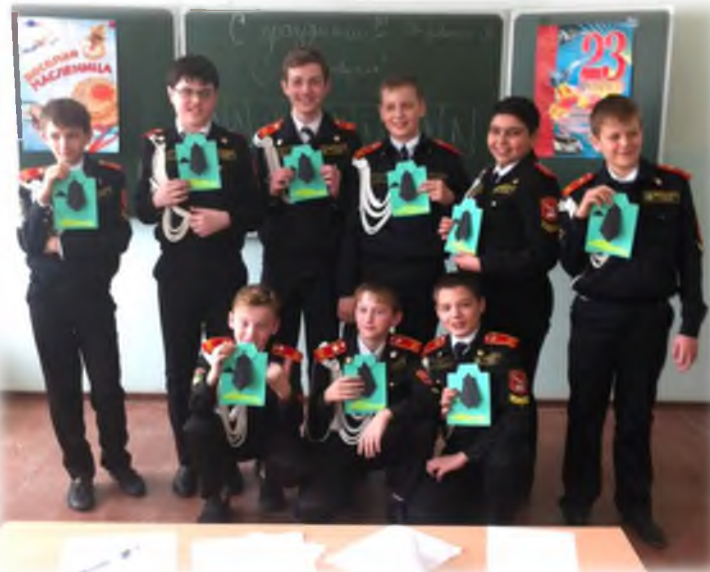
Праздник «Юные защитники Отечества»