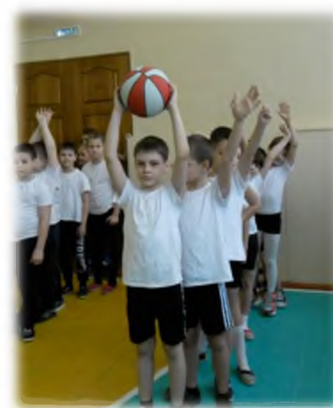
Состязания «А ну – ка, мальчики!»