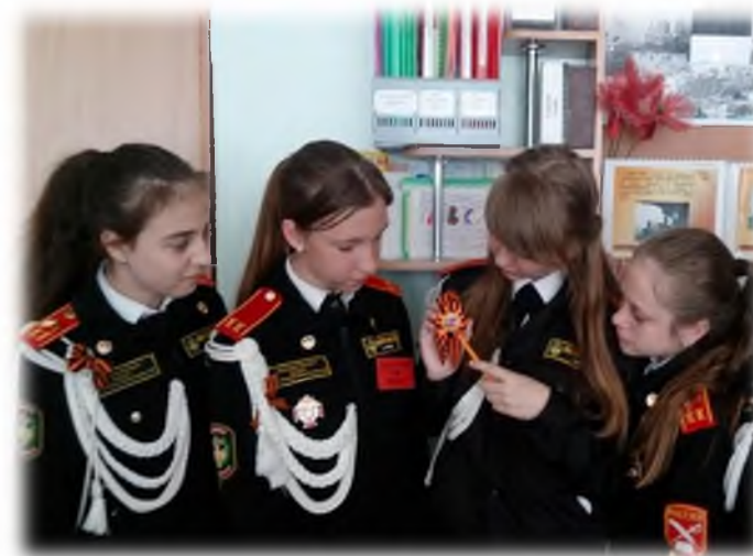
Акция «Георгиевская ленточка»