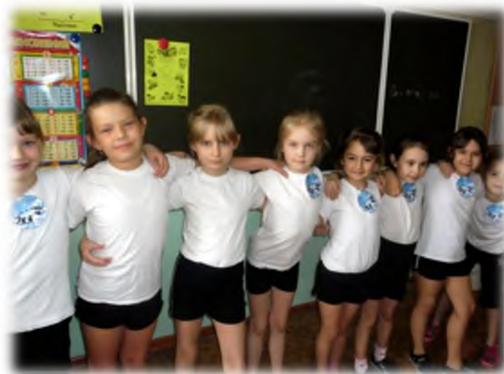
Соревнования «А, ну-ка, девочки»