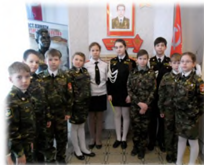
Экскурсия в музей А. Колгатина