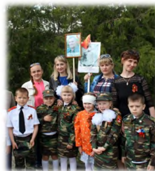
Акция «Бессмертный полк»