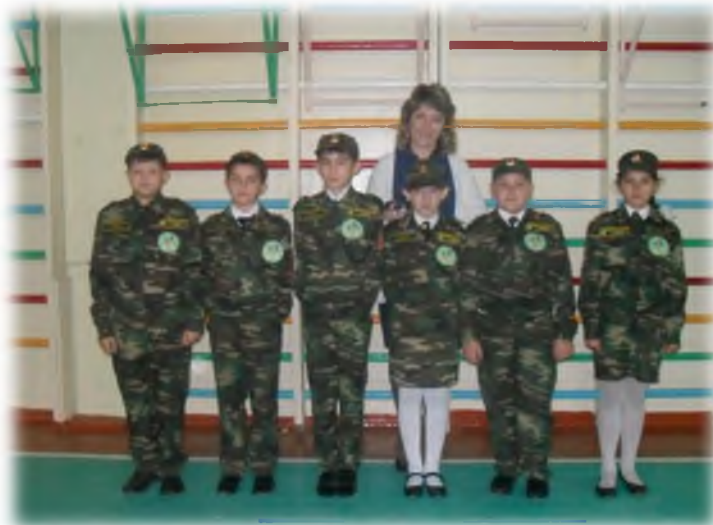
Участники игры «Безопасное колесо»