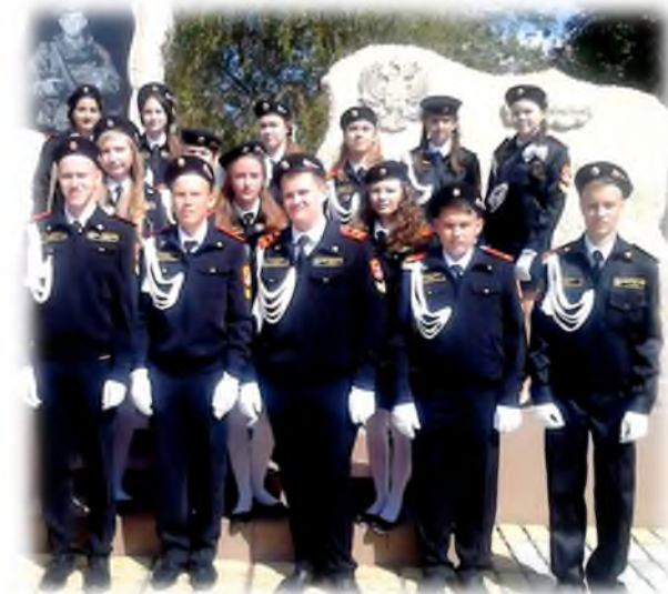
У памятника Герою России А.М. Колгатина