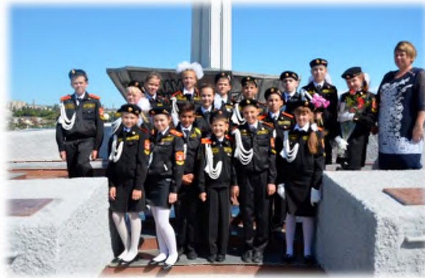
На Аллее Героев