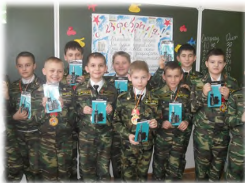
Праздник «Юные защитники Отечества»