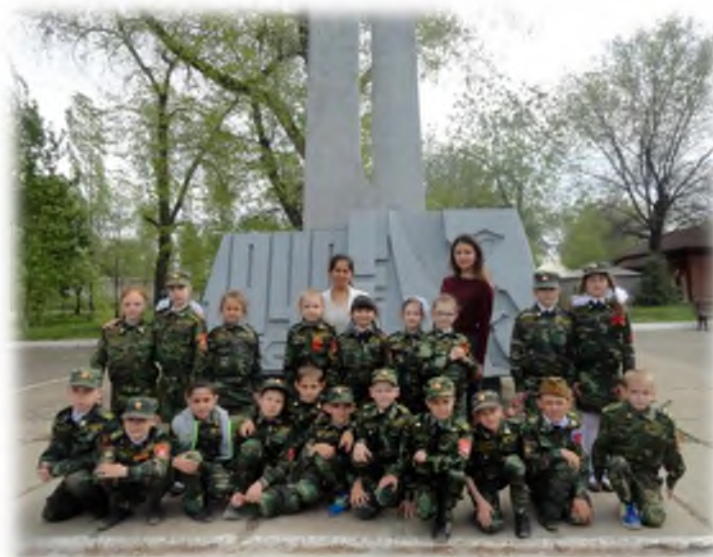
Возложение цветов у памятного знака