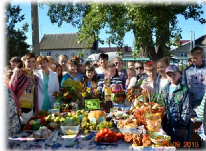
Ярмарка «Осенние дары»