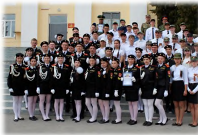
Военно-патриотические соревнования «Служу России!»