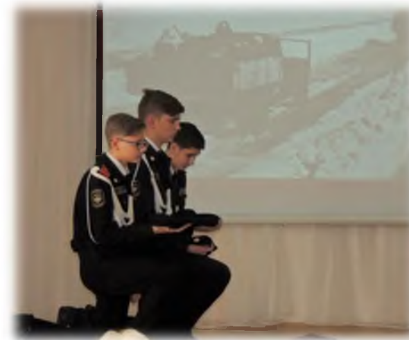
Классный час «Блокада Ленинграда»