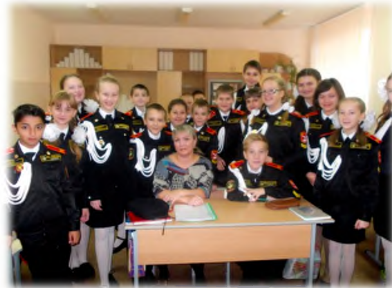
Классный час по профилактике правонарушений