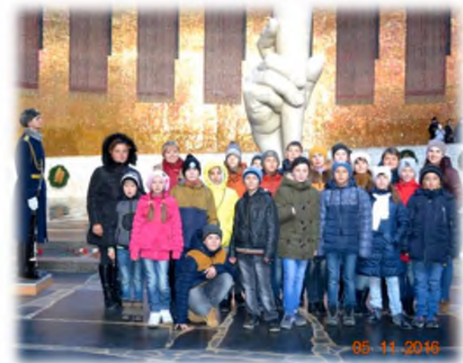
На Мамеевом Кургане