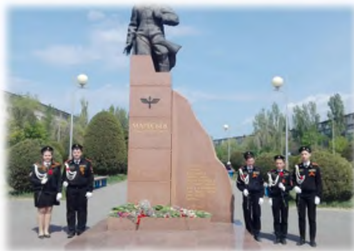
Возложение цветов к памятнику А.П. Маресьева