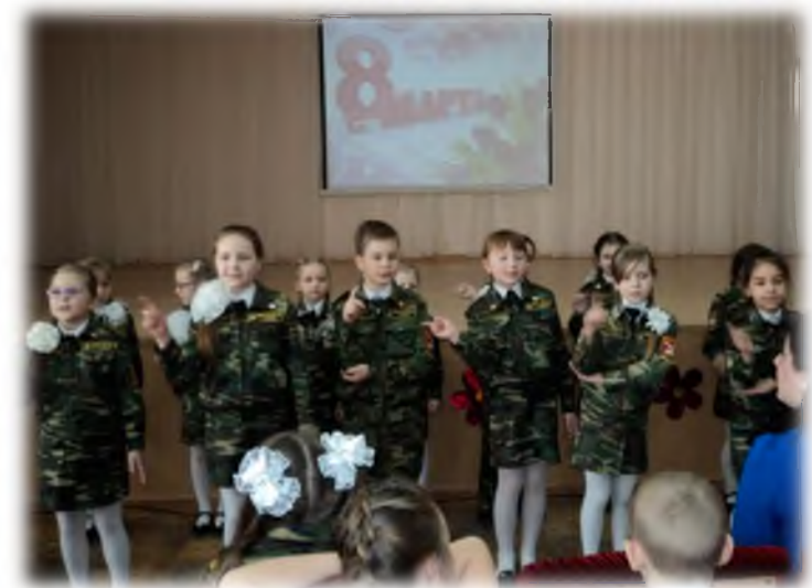
Праздник «Весна идёт, весне дорогу»