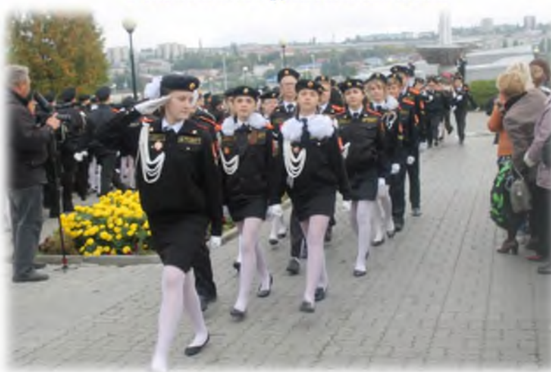
Торжественная церемония «Посвящение кадеты»