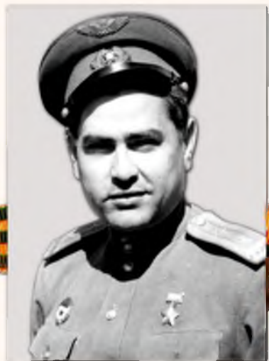
МАРЕШЕВ АЛЕКСЕЙ ПЕТРОВИЧ (1916г. - 2001г.)