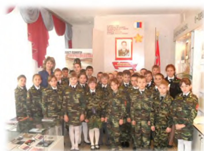
Экскурсия в музей им. Героя России А.М. Колгатина