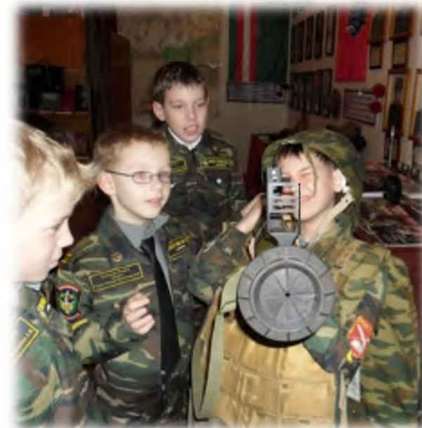
Экскурсия в музей «Боевое братство»