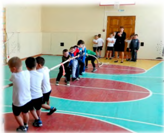
Состязания «А ну – ка, мальчики!»