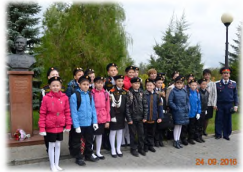
На Аллее Героев