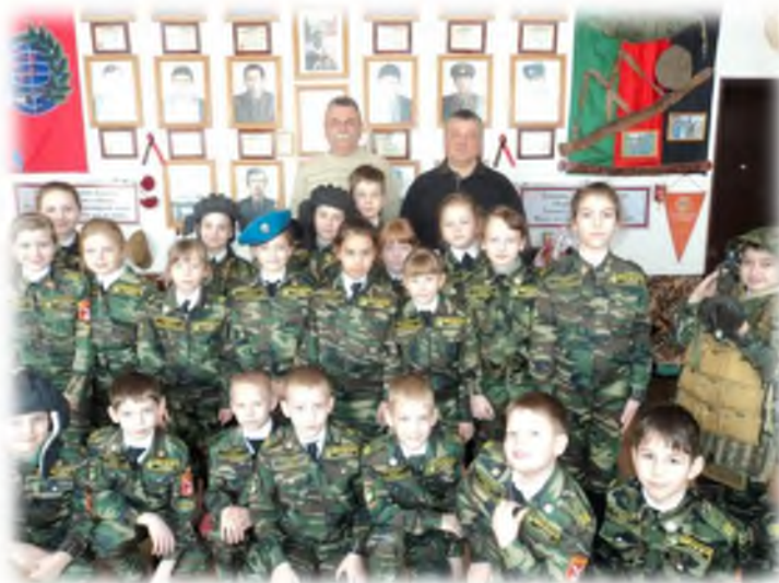
Экскурсия в музей «Боевое братство»