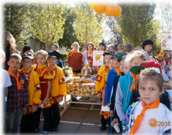
Ярмарка «Осенние дары»