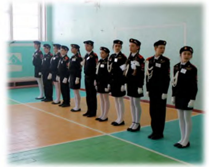
Конкурс строя и песни