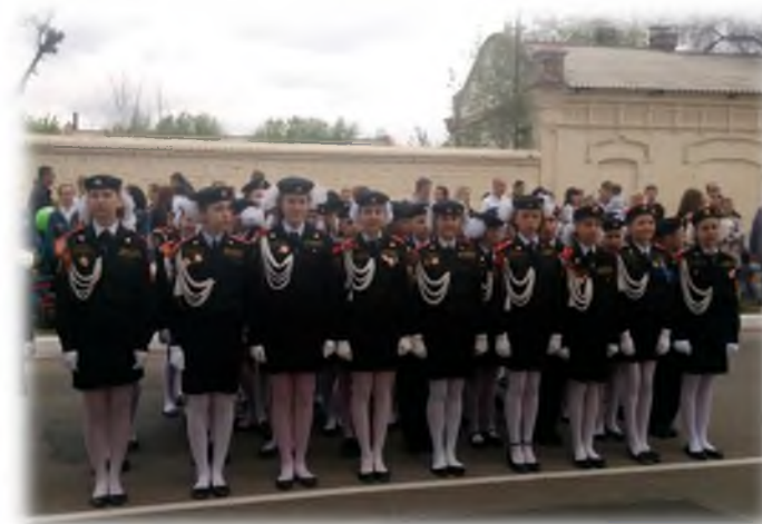
Участники Парада победы