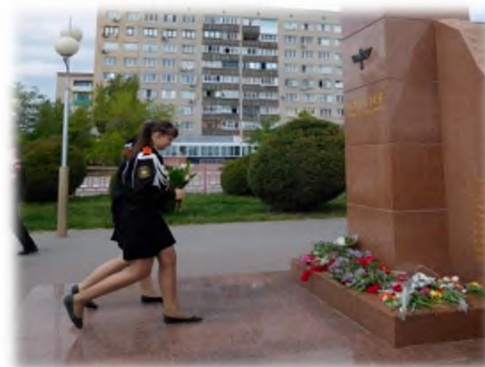
На возложении цветов