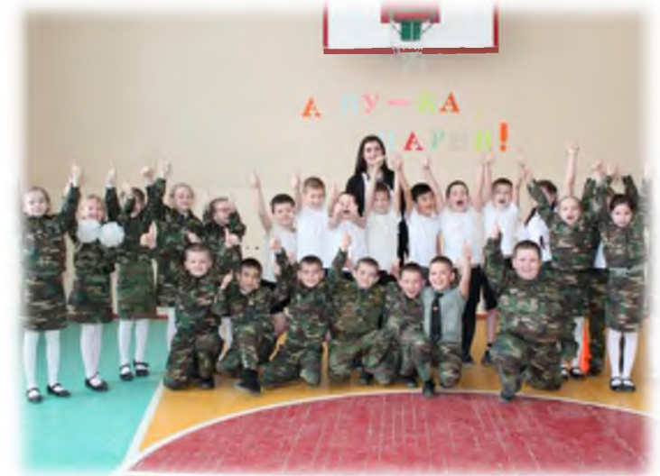
Состязания «А ну – ка, мальчишки!»