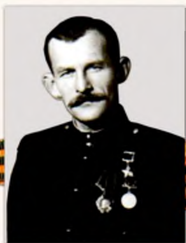
ВОИНОВ МИХАИЛ ЛЬВОВИЧ (1904г. - 1970г.)