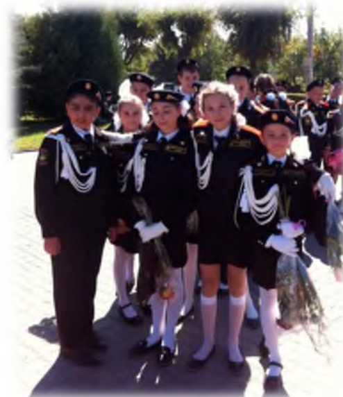
На Аллее Героев