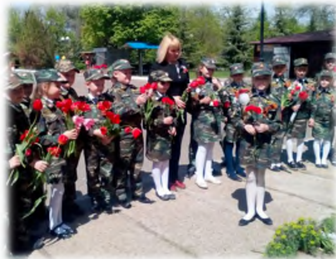
Возложение цветов у памятного знака