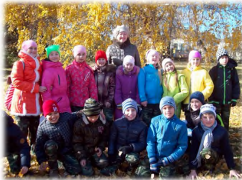
Экскурсия «Осенний парк»