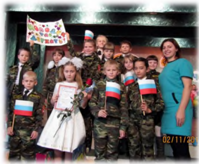
Конкурс чтецов «Я люблю читать»