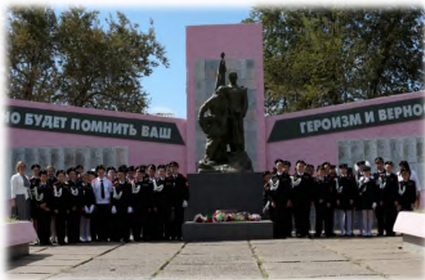
Возложение цветов на братском захоронении