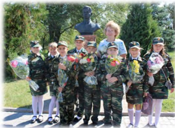
Возложение цветов у бюста Героя Советского Союза