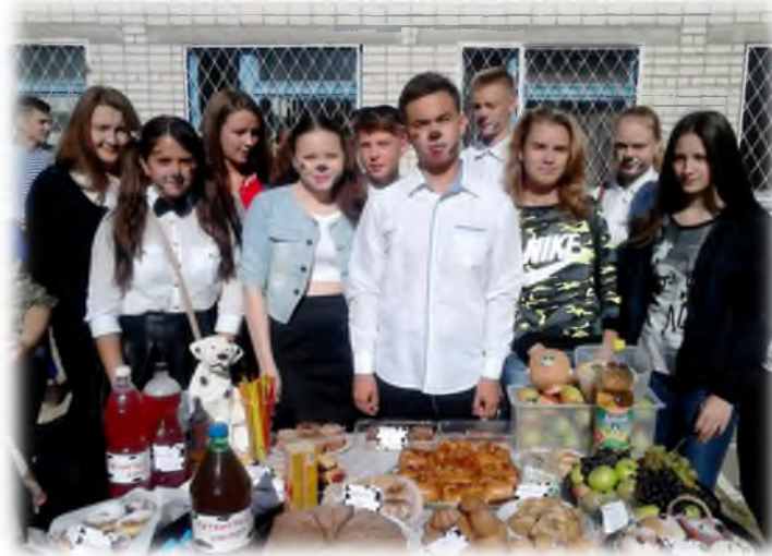
Ярмарка «Дары осени»