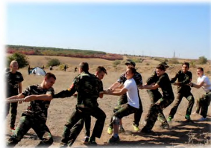
Военные учебные сборы