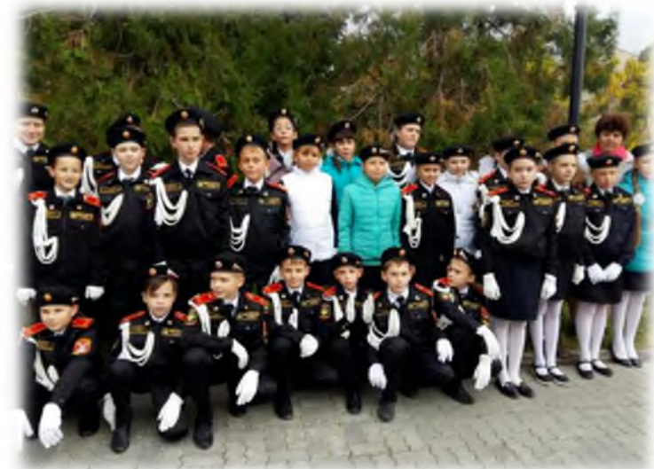
Торжественная церемония «Посвящение в кадеты»