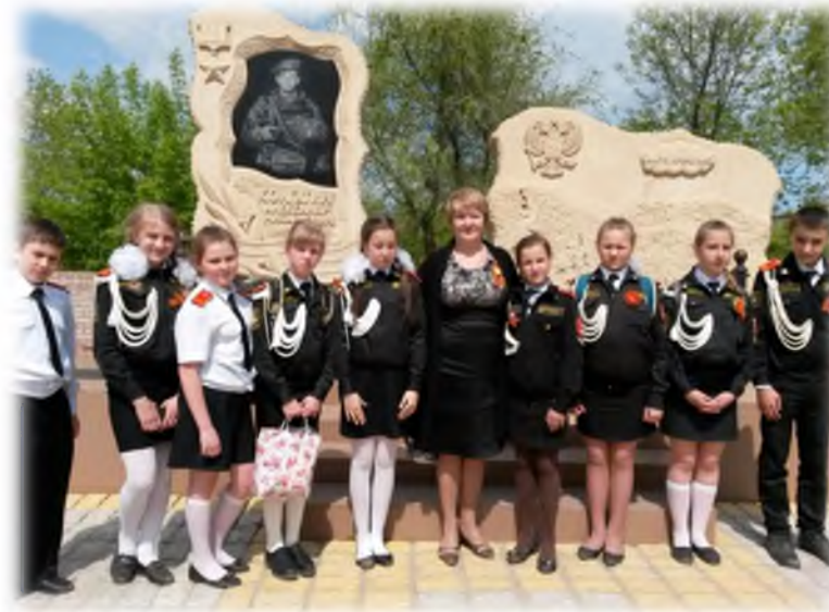
Возложение цветов у памятника Героя России А.Колгатина