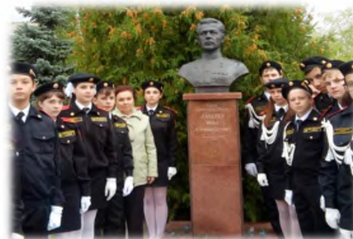
На Аллее Героев