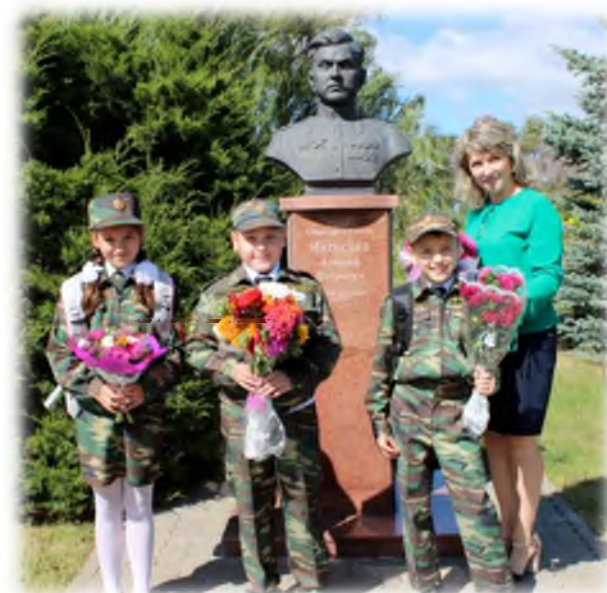
Возложение цветов к бюсту Героя СС