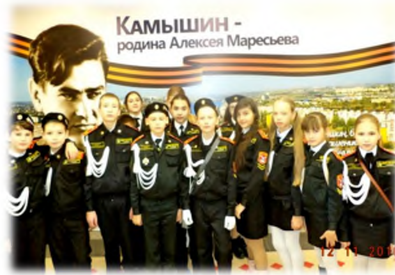
Экскурсия в музей А.П. Маресьева