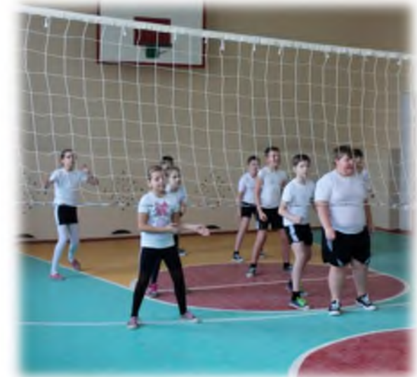
Турнир по тинерболу