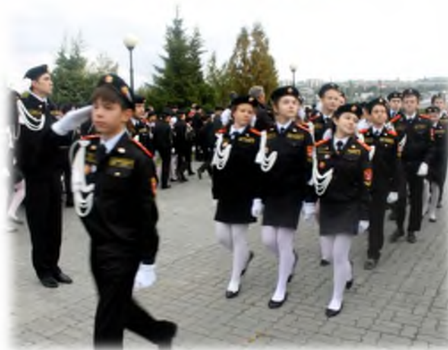
Торжественная церемония «Посвящение в кадеты»