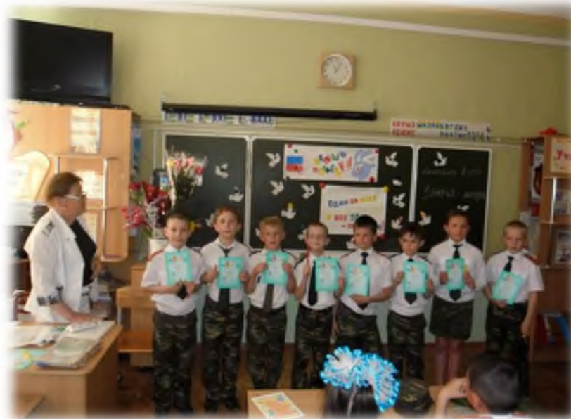
Классный час «День защитника»