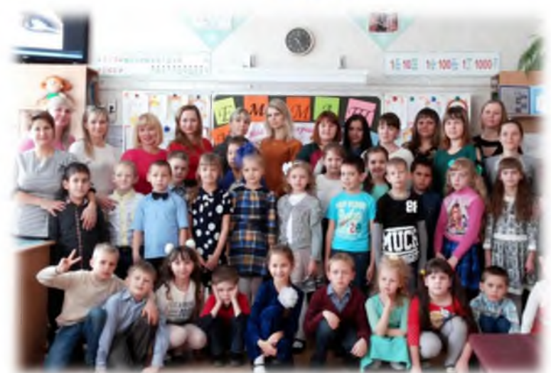
Праздник «Мамочка, мамуля»