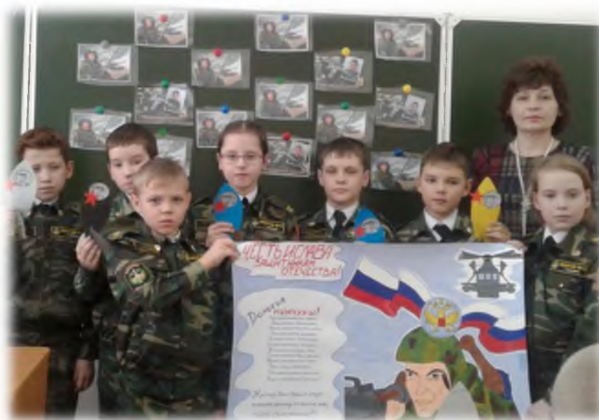
День защитника Отечества