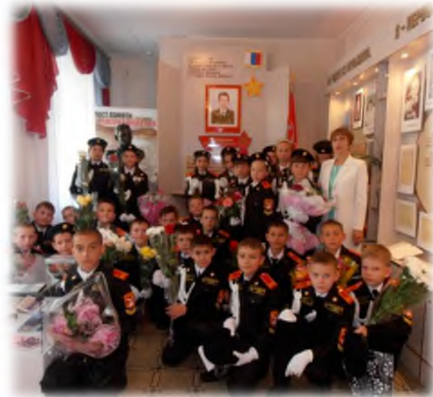
Экскурсия в музей им. Героя России А.М. Колгатина