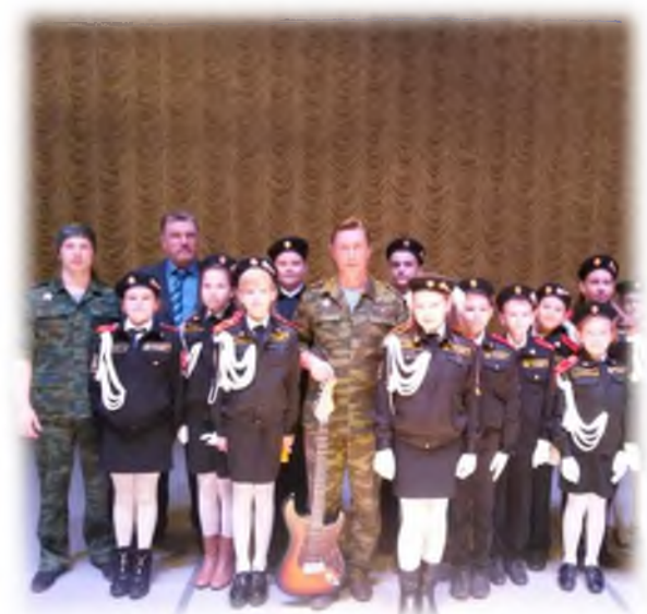
Встреча с афганцами