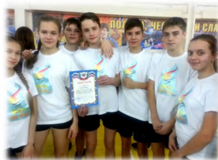
Спортивные состязания «Выбор всегда за тобой»