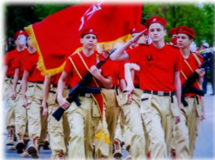
Участники торжественного парада