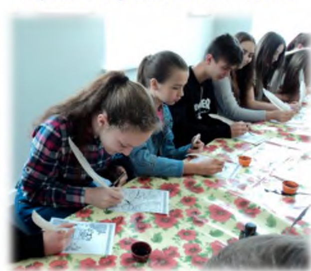
Экскурсия в Художественную галерею