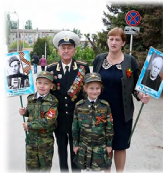
Акция «Бессмертный полк»