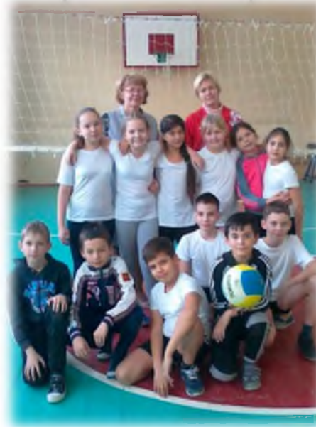
Турнир по тиннерболу