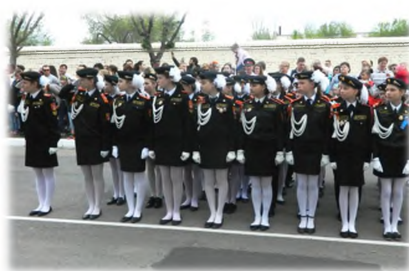
Участники торжественного парада