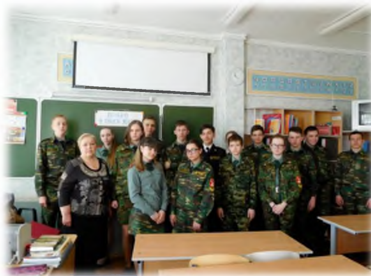
День Героев Отечества