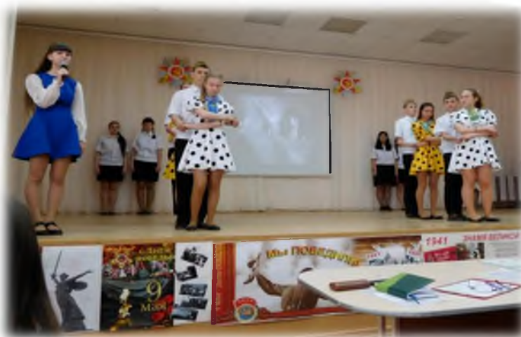
Фестиваль «Весна Победы»