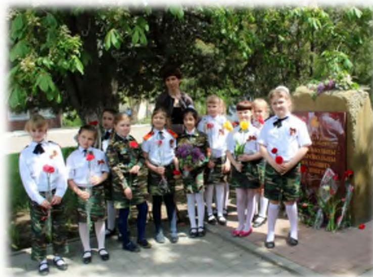
Возложение цветов у памятного знака