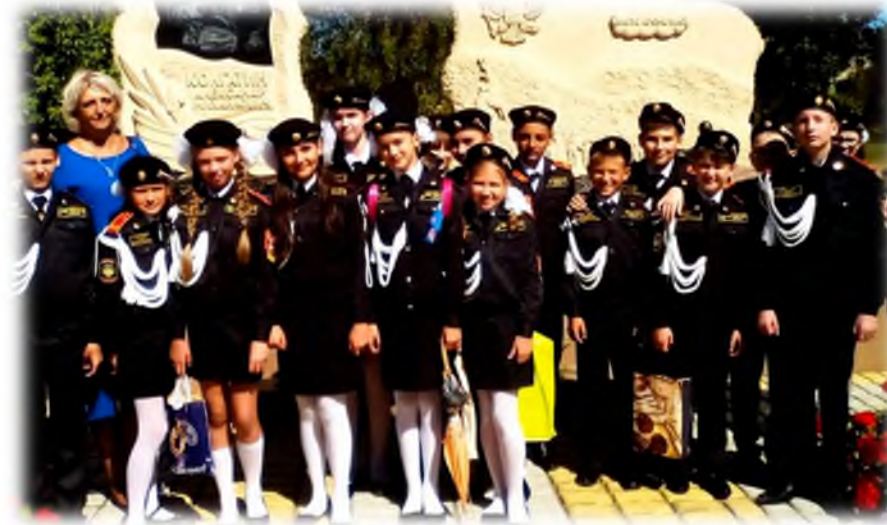
Возложение цветов к памятнику Героя России А. Колгатина