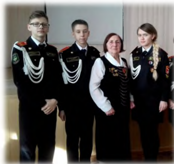
Урок мужества «Дети Сталинграда»