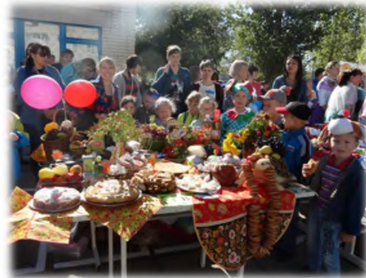
Ярмарка «Осенние дары»