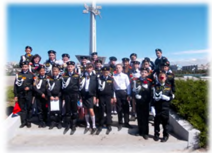
Возложение цветов у Памятного знака