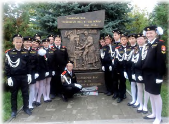
У памятника труженникам тыла