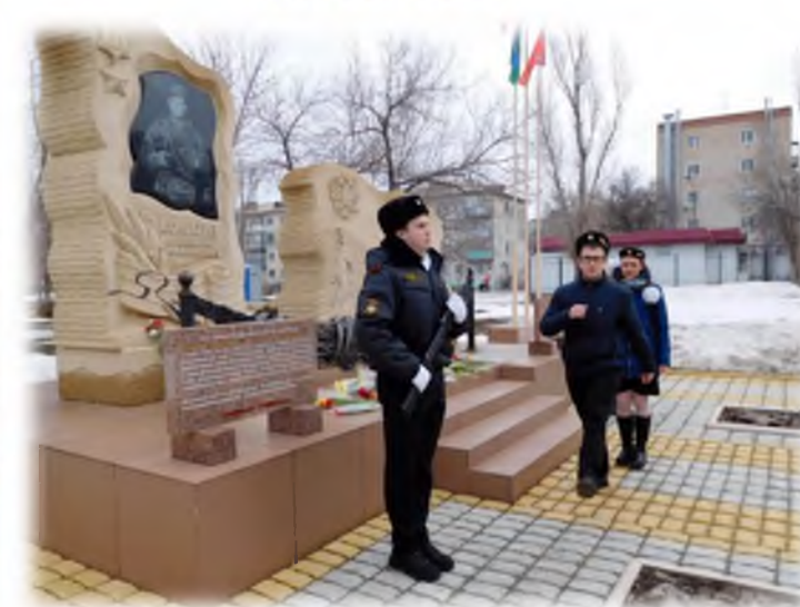
Возложение цветов к памятнику А.М. Колгатина