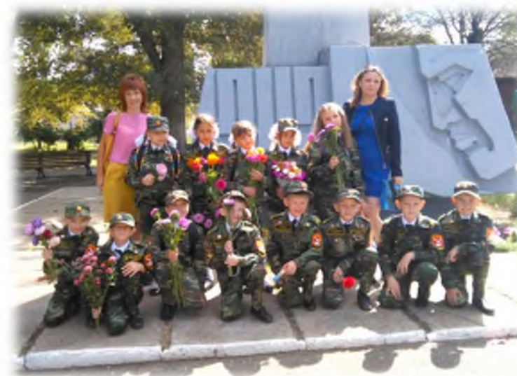
Экскурсия в парк комсомольцев-добровольцев